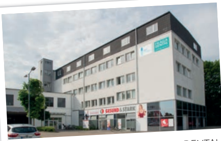
08.11. Bönningstedt: bei FRAGA DENTAL