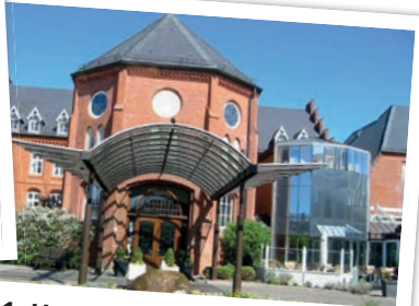
22.11. Husum: Hotel Altes Gymnasium