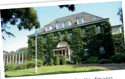
01.11. Kiel: im Kieler Kaufmann