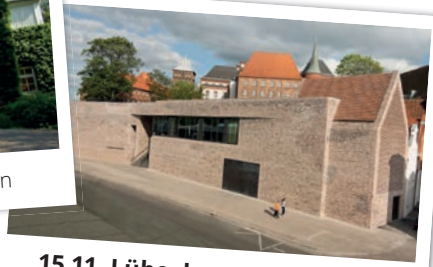
15.11. Lübeck: im Hansemuseum